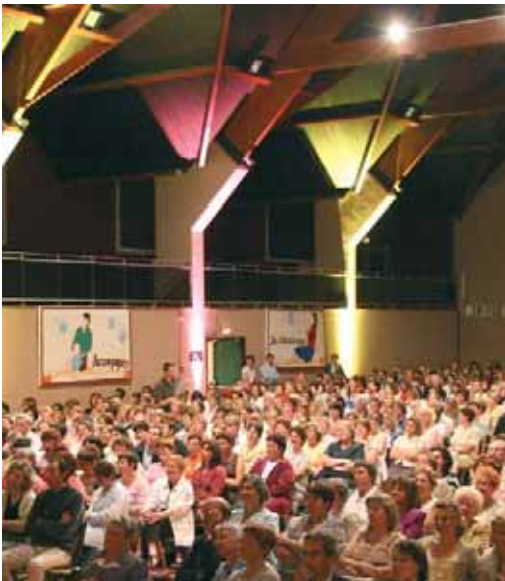
Près de 800 personnes ont suivi avec assiduité les conférences et les débats de la journée.