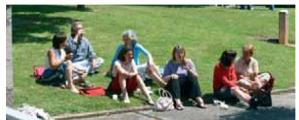
Particulièrement adapté à une journée ensoleillée, le centre international de rencontres de Saint-Vulbas a accueilli la manifestation.