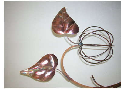
Détail de la sculpture de Bernard Puget, ferronnier d'art