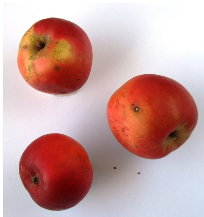
Pommes Camion rouge