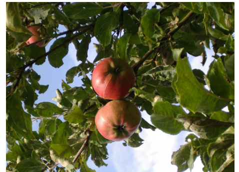
Pommes Croque