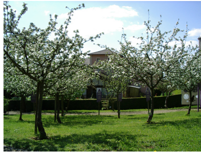
Verger du musée au printemps Cliché coll. MDA