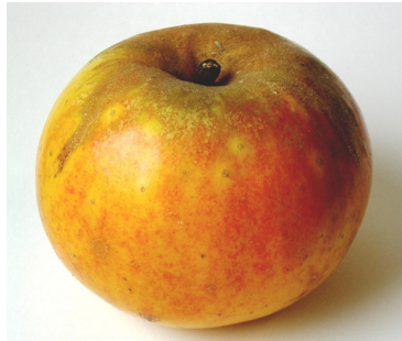
Pomme double-rose de l'Ain