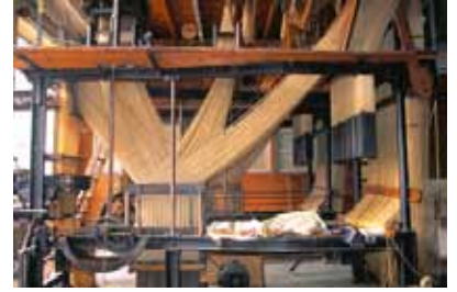
Piqueuse accélérée pour la fabrication des cartons perforés