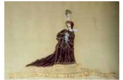
Marque de fabrique, 1884