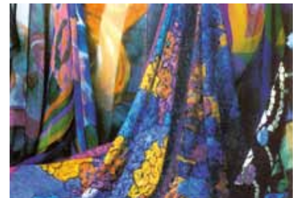
Foulards, carrés et tissus