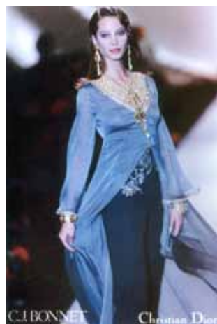
Tissu Bonnet utilisé par la Maison Dior