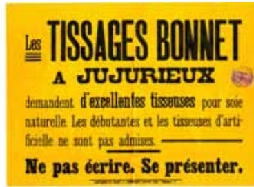
Affiche de recrutement