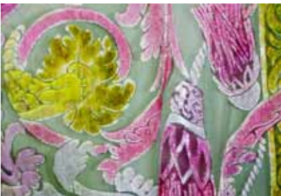
Foulard de la marque Madeleine Vionnet