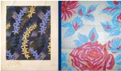
Esquisse et mise en carte textile