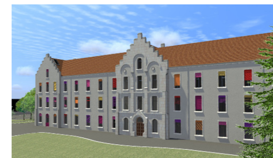
Bâtiment principal (enseignement et administration) © Delers et associés / Jacques Gerbe