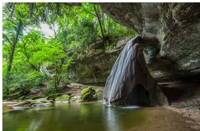
Le Pain de sucre sur la Bèze (affluent labellisé Rivière Sauvage)