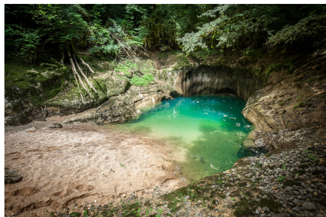
La Source du Groin (labellisée Rivière Sauvage)