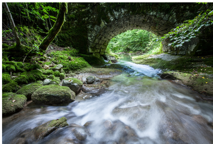
L'Arvière à Vieu (Arvière-en-Valromey)

La suite du travail de labellisation des rivières sauvages est engagée dans l'Ain ; le Département prépare actuellement le dossier de candidature pour la rivière « La Pernaz », qui deviendrait la 5 e Rivière Sauvage de l'Ain. Affluent du Rhône, dans le secteur de Serrières-de-Briord, la Pernaz a été labellisée ENS en 2015 par le Département. Ses caractéristiques pourraient lui permettre d'atteindre le label « Sites Rivières Sauvages » de niveau 2.