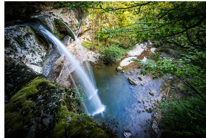
Cascade de la Dorches - Crédit : S. Tournier / CD01

Les Rivières Sauvages de l'Ain sont systématiquement labellisées « Espaces Naturels Sensibles » par le Département dans l'objectif de créer un organe de gouvernance qui puisse suivre la mise en œuvre du programme d'actions « Rivières Sauvages » et valoriser davantage ces cours d'eau d'exception.