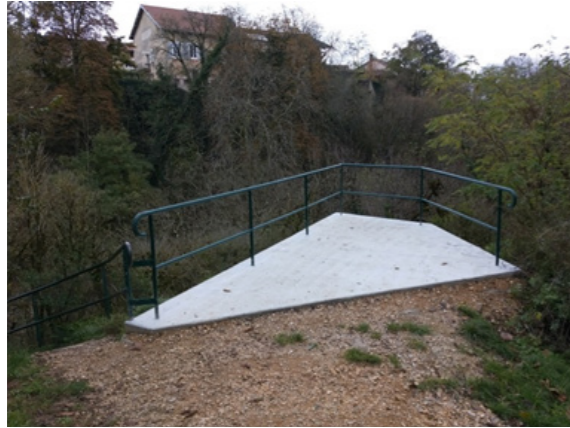
Aménagement d'un point de vue sur la partie haute de l'escalier