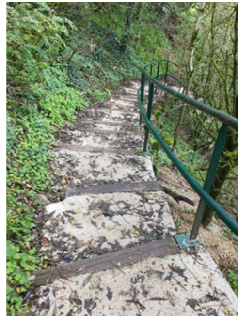
Restauration de l'escalier