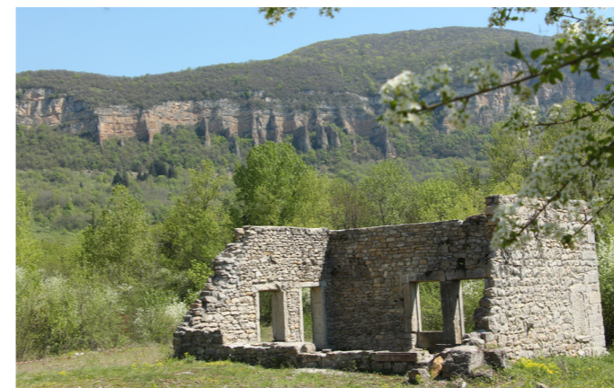
Ancienne forge de la carrière des Meules

La commune de Villebois a souhaité valoriser ces patrimoines en proposant un circuit de découverte des carrières et de l'activité en lien étroit avec le circuit de découverte du bâti, au centre du village.