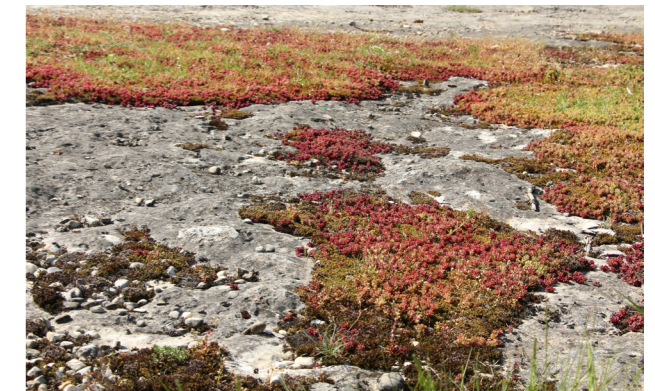
Espèce pionnière se retrouvant sur le plateau

Entre plateau calcaire, milieux ouverts, pelouses sèches et chaos de choin, il règne sur ce site une atmosphère singulière presque méridionale.