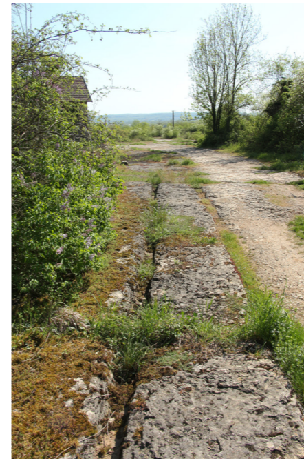
Ornières sur le plateau de l'Octave témoignant du passage de nombreux chargements

Entre le Rhône et les derniers contreforts du Jura bugiste, l'activité économique de l'extraction de la pierre de construction est florissante entre le XV e et le XX e siècle.