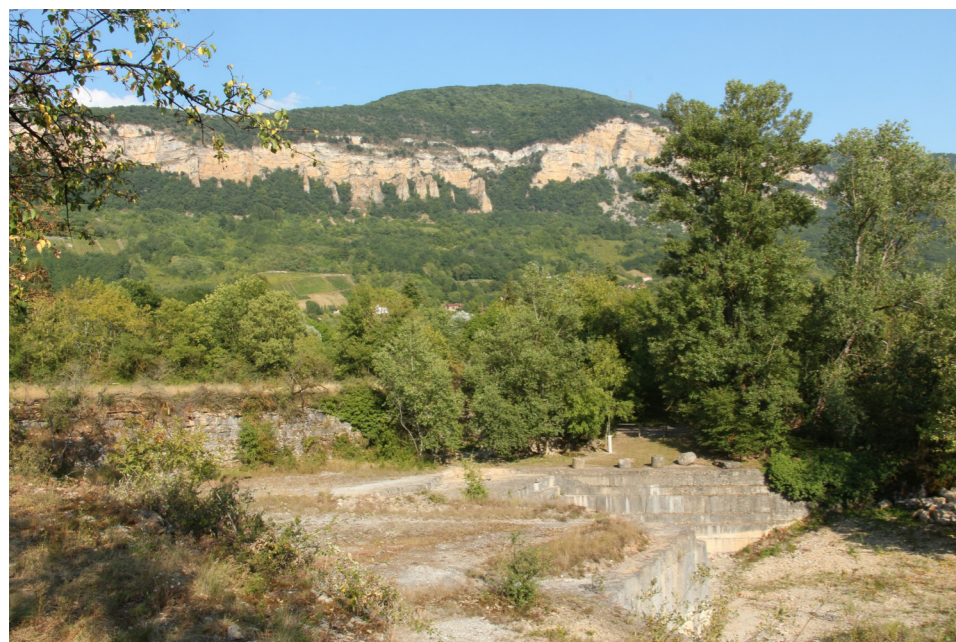
Front de taille de l'ancienne carrière des Meules. Aperçu des Demoiselles sur les piémonts du Bugéy

Le Département de l'Ain en labellisant ce site accompagne la Commune de Villebois, en lien avec la Communauté de Communes de la Plaine de l'Ain, pour valoriser cette richesse patrimoniale témoignage de l'activité économique passée.