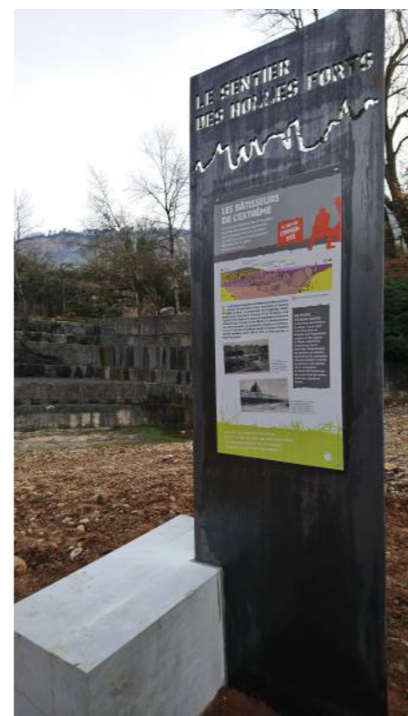
Aperçu des panneaux d'interprétation, support réalisé en pierre de Villebois