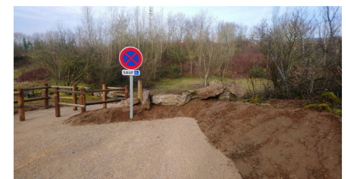
Place PMR à l'entrée du site