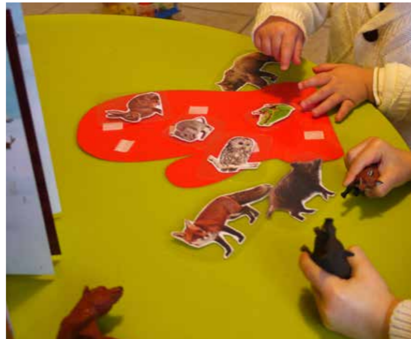
La mouffle à animaux créée par Claudine invite les enfants à développer leur vocabulaire.

Vers 2 à 3 ans, l'enfant va développer son langage en utilisant des mots de plus en plus nombreux et complexes. Attention, s'il les écorche, c'est parce qu'il n'est pas encore en capacité de s'exprimer correctement. Il aura alors besoin d'un peu plus de temps et de beaucoup de tendresse et de bienveillance. Pour réussir, il aura également besoin d'être valorisé et encouragé. ●