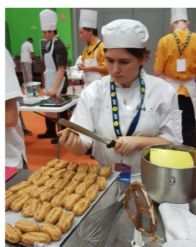
Hôtellerie Restauration Alimentation