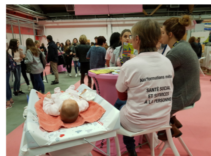
Social-Santé Service à la personne