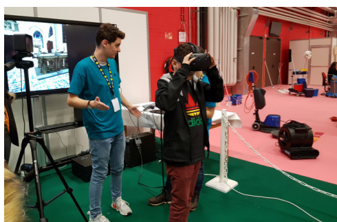
Métallurgie Industries technologiques