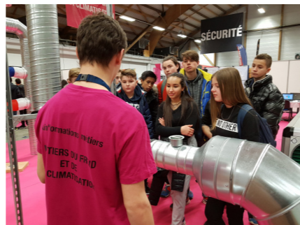
Froid et conditionnement de l'air