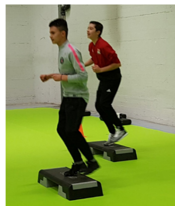
Métiers du sport