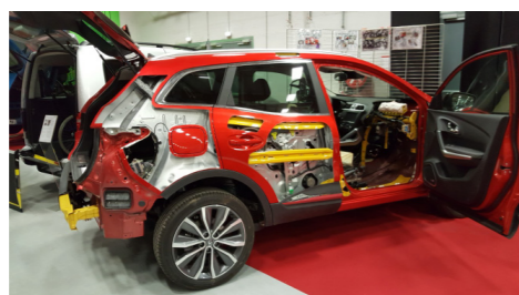
Métiers de l'automobile