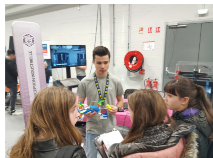
Numérique - Informatique