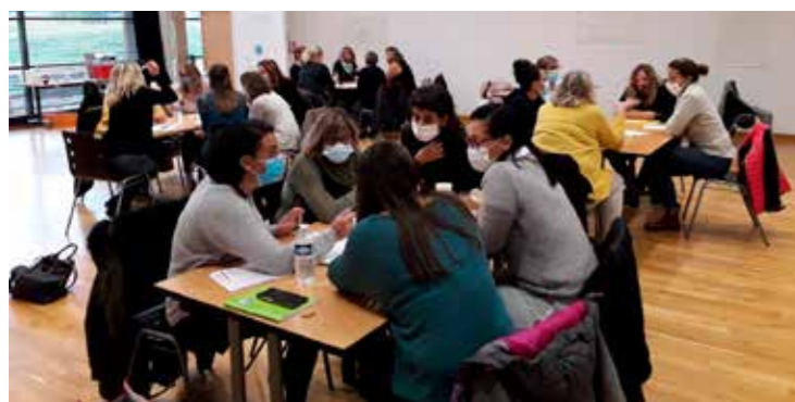
Vingt et une MAM ont été conviées à cette première rencontre.