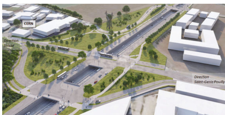
Le projet soumis à la concertation publique