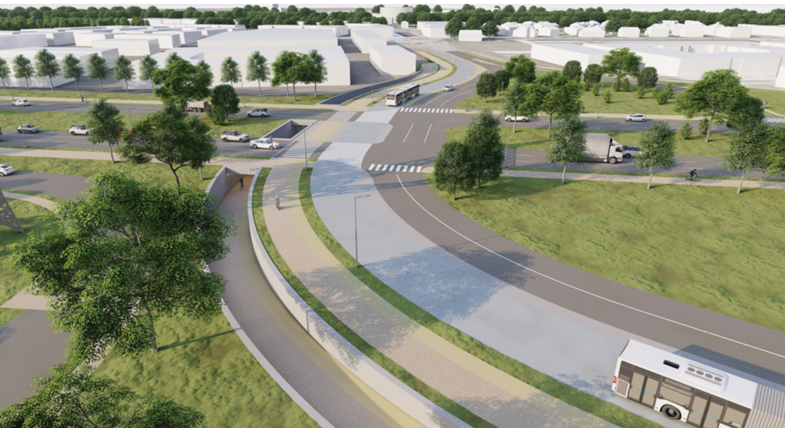
Le choix du Département : un carrefour à niveau avec aménagement d'un passage inférieur pour les piétons et les cycles, axe Est-Ouest