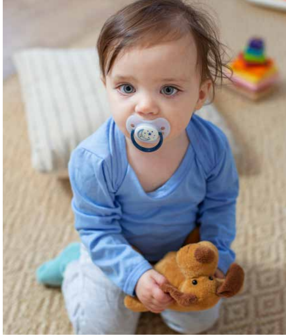
La tétine doit être remplacée régulièrement.

Certains enfants en ont besoin longtemps, d'autres moins ou pas du tout. Mais l'usage de la tétine est à surveiller et limiter.