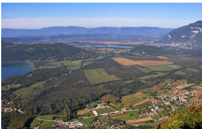
Lac du Bourget – Marais de Chautagne

Compte tenu de la cohérence écologique, fonctionnelle et historique des sites, interconnectés par la nappe phréatique du Rhône et véritable annexe hydraulique du haut-Rhône français, il a été proposé une extension du site existant à ce nouveau périmètre.