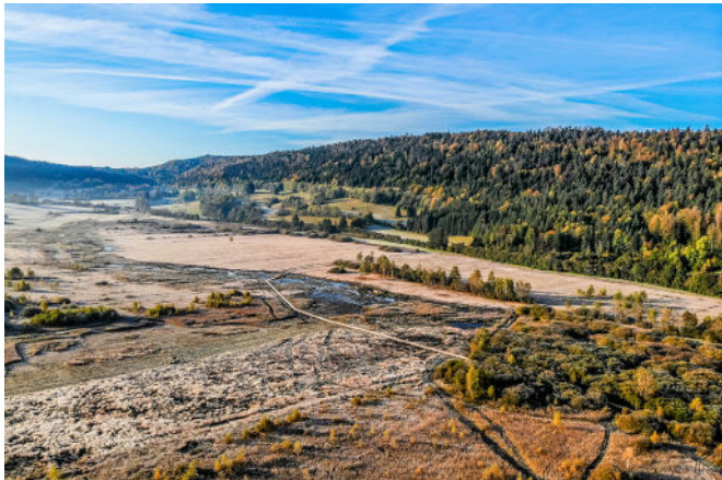
Marais de Vaux

Le périmètre de 1 050 hectares se concentre sur un ensemble de zones humides (environ 40), majoritairement des Espaces Naturels Sensibles (ENS) du Département, caractérisées par des systèmes tourbeux et marécageux, à une altitude minimale de 750 mètres. Parmi ces zones humides d'une grande richesse, peuvent être cités, les marais de Vaux et en Jarine ou la tourbière de Cerin.