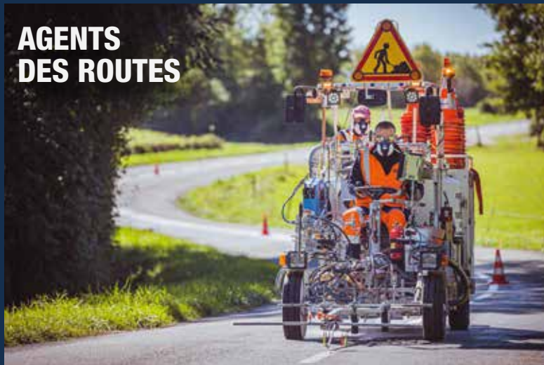
AGENTS DES ROUTES