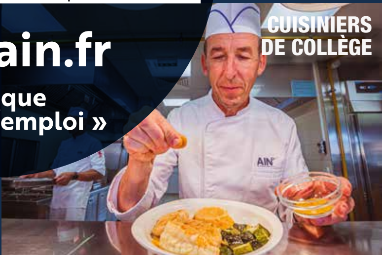
CUISINIERS DE COLLÈGE