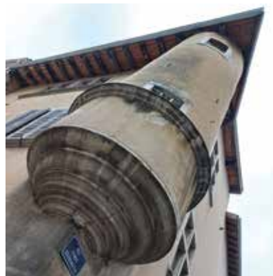
Une fusée dans la ville @jn_bx