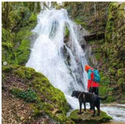
Dame Nature @moimesgodassesetmonchien