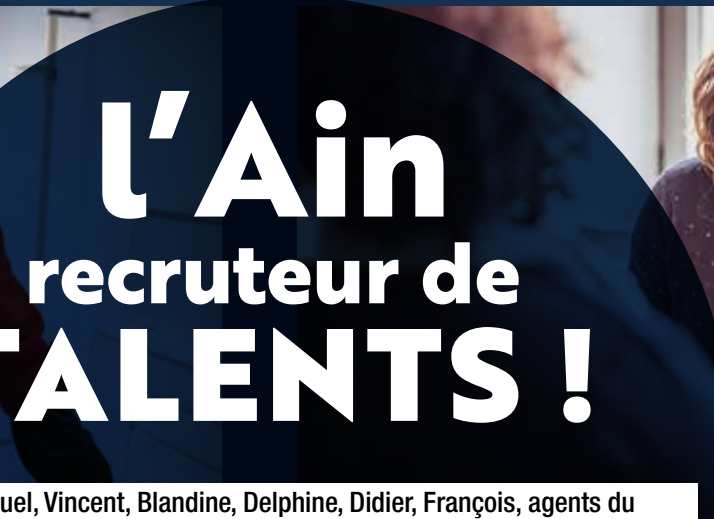
AGENTS DU SOCIAL