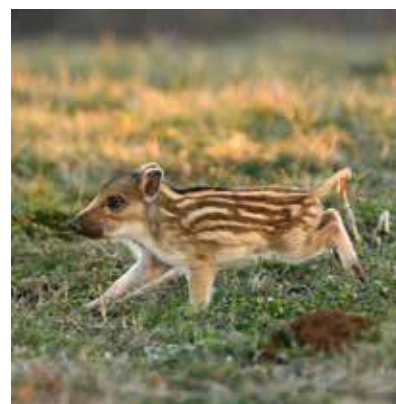
Papa est là ! @sdebias