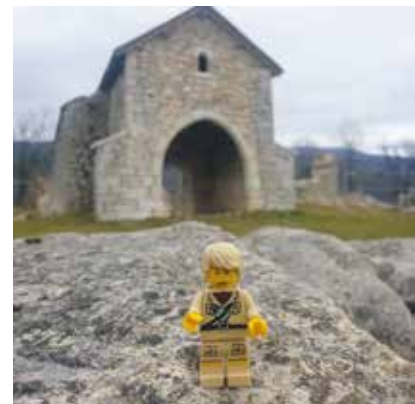
Saint-Alban et Ludwig @lesaventuresdeludwig