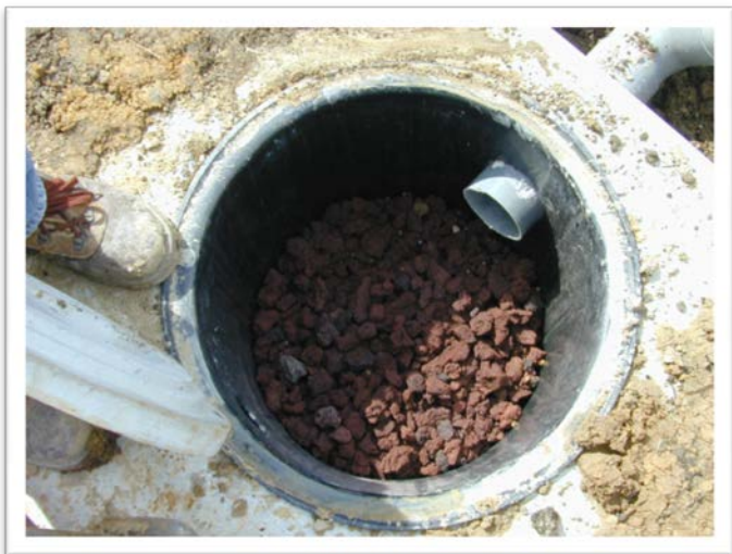
Préfiltre en pouzzolane