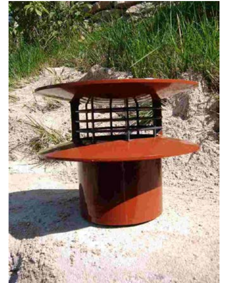
Vue grossie d'un extracteur statique

Extracteur statique dépassant de 40 cm le faîtage du toit