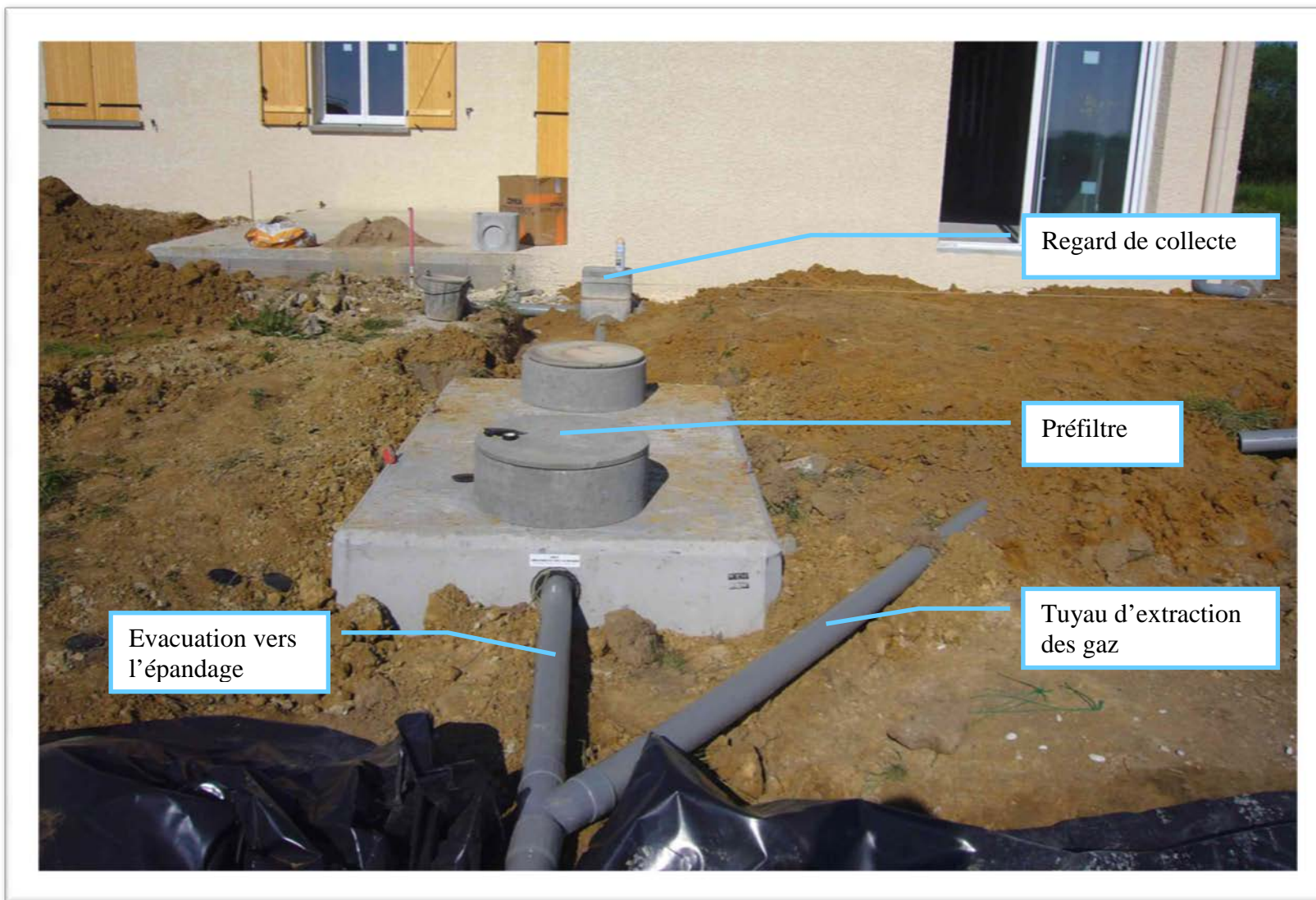
Fosse en béton avec préfiltre intégré