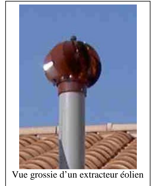
Vue grossie d'un extracteur éolien