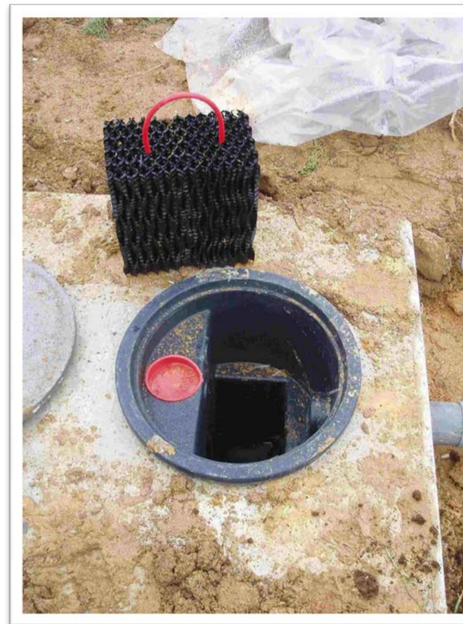
Préfiltre en plastique alvéolaire (structure de nid d'abeilles)